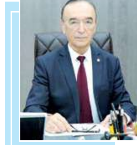
Шавкат АЮПОВ, Ўзбекистон Фанлар академияси президенти, Ўзбекистон Қаҳрамони, академик