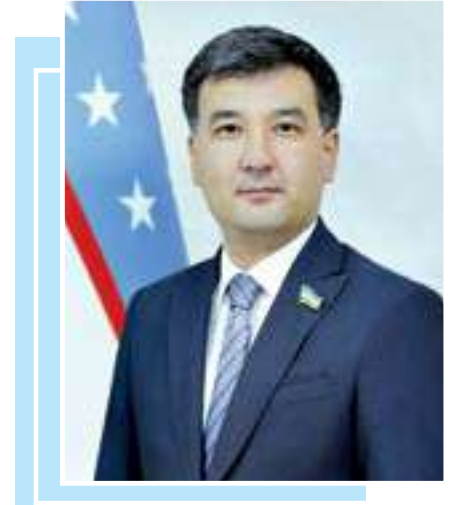
Козимжон ТОҶИЕВ, Олий Мажлис Қонунчилик палатаси депутаты

Кувайт — Форс кўрфазини минтақасида барқарор сиёсий тизимни, кучли иқтисодиётини ва ривожланган иجتимой инфратузилмаси билан ажралаб турадиган мамлакат. Ушбу давлат минтақада тинчлик ва барқарорликни таъминлашда ҳам алоҳида аҳамиятга эга.