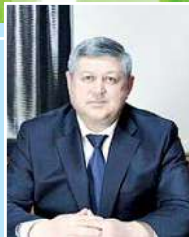
Садриддин ТУРАБЖОНОВ, техника фанлари доктори, академик

Мамлакатимиздаги бугунги шиддатли ислохотлар замирида нафақат жамият, балки келажак авлод тақдири мужассам. Бу эса эртасига беварқ бўлмаган ҳар қандай инсонни сергакликка, ташаббусга чорлайди. Президентимиз таъкидлаганидек, табиат билан ҳамнафас, уйғун ҳолда яшаш, атроф-муҳитни асраб-авайлаш ажодларимиз ва биз учун қадимдан маънавий мерос бўлиб, миллий қадриятга айланиб қолган. Аждодларимиз эътиқотида табиатни муқаддас билиш, кўркам боғлар барпо этиш бош ғоя сифатида илгари сурилган. Бундан халқимиз минг йиллар давомида табиат, атроф-муҳит, ҳайвонот ва наботот мувозанатини сақлаш ғояси билан тарбияланиб келганини англаш мумкин.